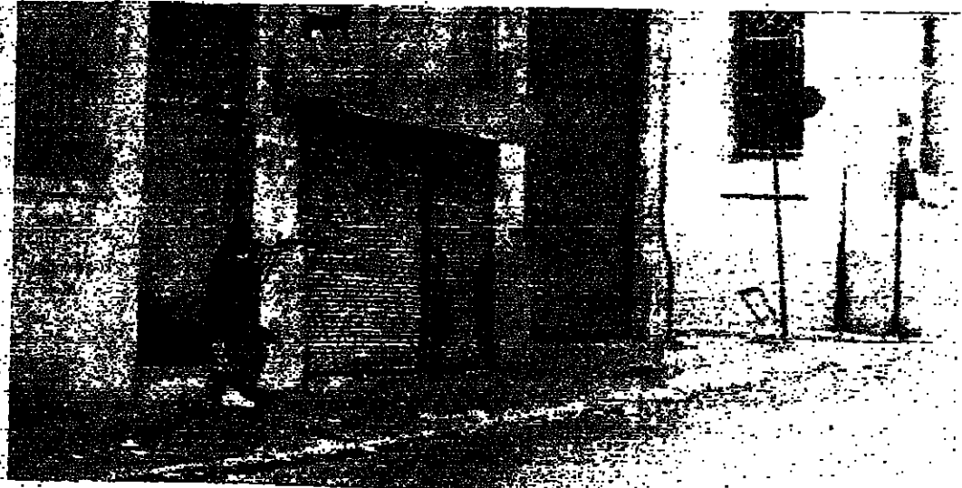
سيارة في الشياح تجرت اثناء الماركة